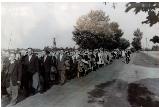
Zamieszczone tu i na pierwszej stronie zdjęcie pochodzi z parafialnej pielgrzymki z Wręczyca na Jasną Górę, 15 sierpnia 1964

Gdy napełnieni Duchem Świętym apostołowie poszli na cały świat, głosząc Ewangelię, jeden z nich, Jan, apostoł miłości, w szczególny sposób "wziął Maryję do siebie" (J 19, 27). Głęboka więź z Jezusem i z Maryją pozwoliła mu tak skutecznie głosić, że "Bóg jest miłością" (1 J 4, 8. 16). Słowa te zacytowałem i ja jako przesłanie pierwszej encykliki mego pontyfikatu: "Bóg jest miłością" - Deus caritas est! Ta prawda o Bogu jest najważniejsza, najistotniejsza. Wszystkim tym, którym trudno uwierzyć w Boga, dziś powtarzam: "Bóg jest miłością". Bądźcie i wy, drodzy przyjaciele, świadkami tej prawdy. Będziecie nimi skutecznie, jeśli będziecie się uczyć w szkole Maryi. Przy Niej doświadczycie, że Bóg jest miłością, i tego kochającego Boga będziecie przekazywać światu, w tak różnorodne i bogate sposoby, jakie Duch Święty wam podpowie."