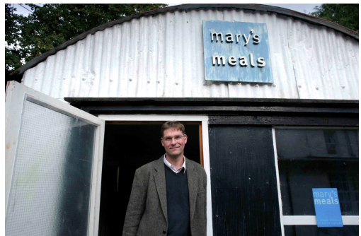
Siedziba fundacji „Mary's meals” i jej założyciel Magnus MacFarlane-Barrow